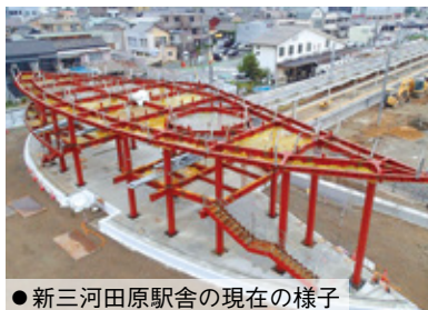
●新三河田原駅舎の現在の様子