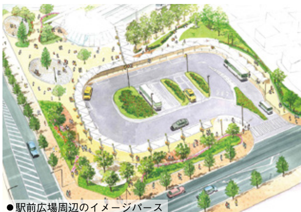
●駅前広場周辺のイメージパース