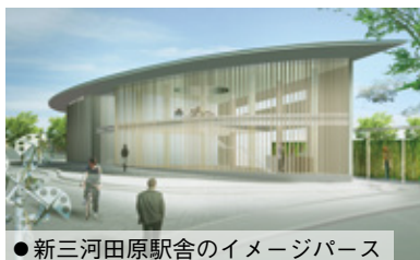
●新三河田原駅舎のイメージパース