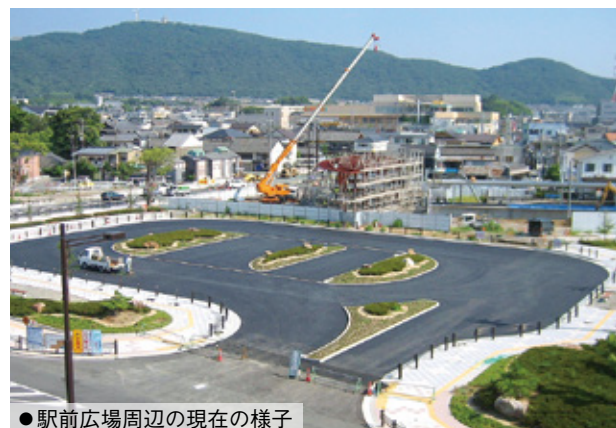
●駅前広場周辺の現在の様子