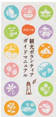
▲観光ボランティア ガイドマニュアル

▼開催日 6月5日(平成26年2月の期 間で全5回) ▼場所 渥美支所会議 室ほか ▼内容 田原市ならではの 魅力を知る講師を招き、講義と現地 案内レッスン ▼定員 30名(先着 順) ▼受講料 無料 ▼申し込み 6月13日(木)までに電話または FAX・Eメールにて ※申込者には、主催者から詳しい開 催案内とガイドマニュアルをお送り します。 ▼商工観光課 23局35222 FAX 22局3817 syoko@city.tahara.aichi.jp