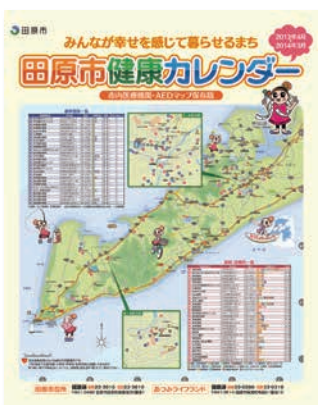
▲田原市健康カレンダー