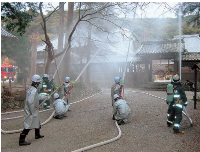
▲放水訓練を行う消防署員と南部分団2号車の消防団員

文化財防火デー (1/26)に伴い、長興寺 (大久保町)で消防訓練が行われました。訓 練では、愛知県指定文化財に指定されてい る木造観世音立像の収蔵庫付近からの出火 を想定。参加者21名は、通報訓練や消火訓練 などを通じ、一連の動作を確認しました。