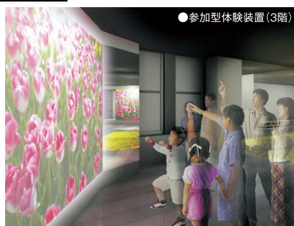
●参加型体験装置(3階)