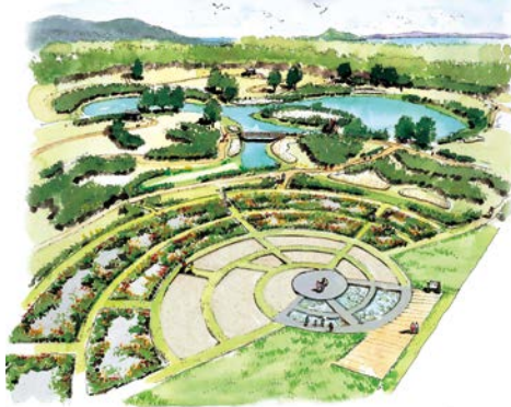
●伊良湖休暇村公園(イメージ)