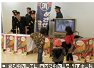
●「愛知消防の日」市内で消防団をPRする団員

い消防団に するため、 『がんばろ う！消防団 応援事業所 制度』を導 入し、市内 の事業者の 方のご協力