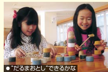
●“だるまおとし”できるかな