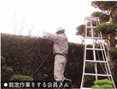
● 剪定作業をする会員さん

毛筆の賞状書きの仕事を30年近く続けています。この日も一枚の賞状を丁寧に書いていました。