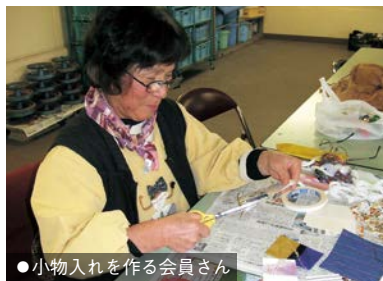
● 小物入れを作る会員さん

バキが屋敷をぐるりと囲んでいるお宅で会員さんたちが脚立に上がりリズムよく剪定していました。このお宅では毎年、年末になるとセンターに依頼して整えてもらっているそうです。