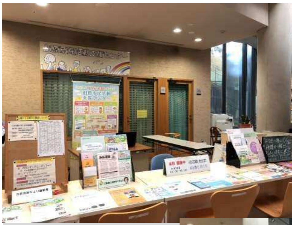
◆田原市民活動支援センター

○市民公益活動における連携の意向（他の団体に対する協力要請等）や実現状況を把握するとともに、連携・協力・支援が進められるように、情報ネットワークの形成や活動・人材情報の把握・提供に取り組みます。