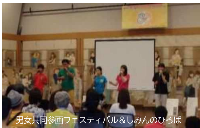
男女共同参画フェスティバル&しみんのひろば

○NPO等の団体との協働事業を通じて社会貢献を行おうとする 事業者や学生等のボランティア は増えています。 市民やNPO団体と事業者等との協働を促進するため 、今後も相互に情報提供し合い、いっそう連携を深めていくことが必要とされています。