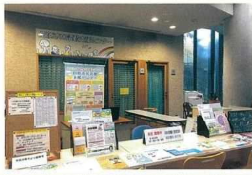
開設時間 火・土曜日 正午～午後4時