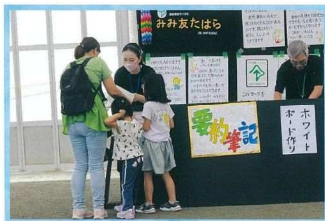
▲「第17回しみのひろば」での活動の様子