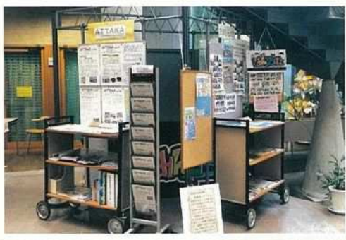
場所 田原文化会館 フリースペース