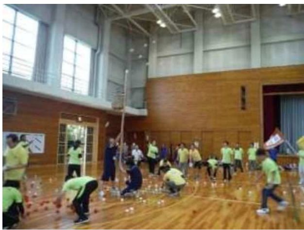
◆交流スポーツ大会