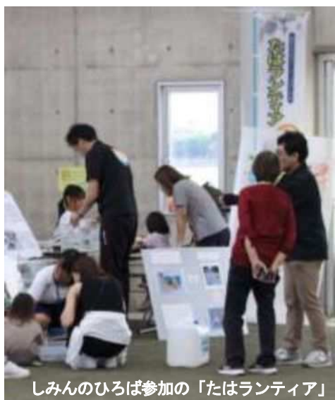
しみんのひろば参加の「たはランティア」