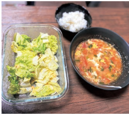
▲田原の野菜を家族で楽しんでいます

です。ゆでる前に、鍋に塩とシウウガを入れて、お湯を沸かします。その間にキャベツを四角に切って3分ほどゆでます。キャベツを半分くらい取り出してキャベツの汁にトマトを加えます。完成したら、ゆでキャベツと、キャベツ汁を味わうことができます。家族全員トマトも好きで、豚肉トマト汁や、卵トマト汁をよく作ります。田原のキャベツは甘くて、美味しいです!