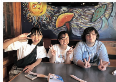
ジョージタウン市にて

成章高校とスコット高校は姉妹校提携をして、生徒の派遣と受け入れを通じた相互交流を続けています。