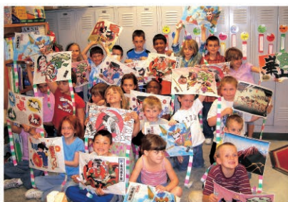
ジョージタウン市にて

ジョージタウン市への中学生海外派遣は、14回行われ、多くの生徒がさまざまな体験をしました。