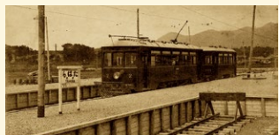
田原駅に停車中の渥美線電車 1924(大正13)年ごろ