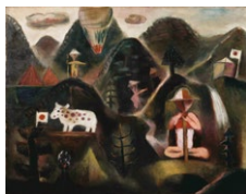
古賀春江 夏山 1927(昭和2)年 愛知県美術館蔵