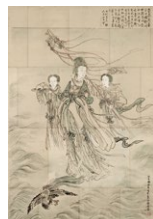
渡辺崋山 亀台金母図 1811(文化8)年