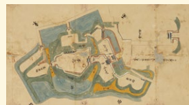
田原城修理絵図 1715(正徳5)年

渥美半島の2万年の歴史を特徴的ないくつかの切り口からひもときます。 (企画展示室2では郷土作家の作品等を展示することもあります)