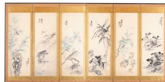
市指定文化財 椿椿山 花卉図屏風 左隻 1851(嘉永4)年

崋山の弟子の椿山は花鳥画を得意とし、崋山の息子の小華は草花などを描くのを得意としました。この2人を中心に崋椿系の画家が花や木、草を描いた作品を展示します。