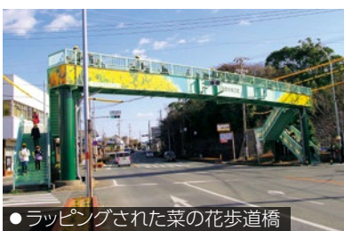
●ラッピングされた菜の花歩道橋