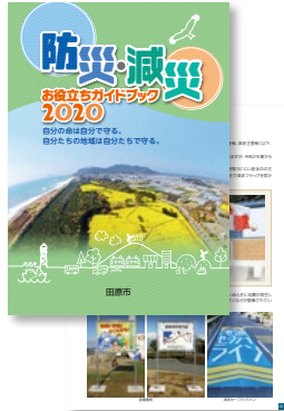
※画像は作成中のものです

平成27年度に作製し、全戸配布した「防災・減災お役立ちガイド」を5年ぶりに改訂します。