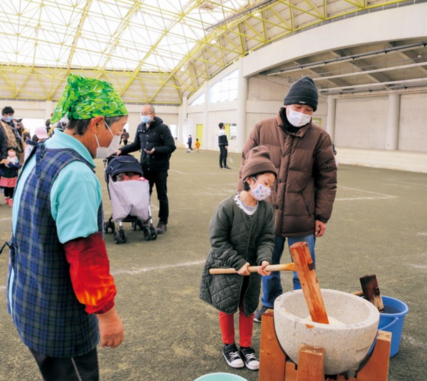
▲餅つきをする子どもと見守る保護者