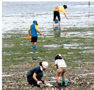
▲自然とふれあい、自然を楽しむ自然塾を開催～ベザイの浜で干潟の生き物観察！