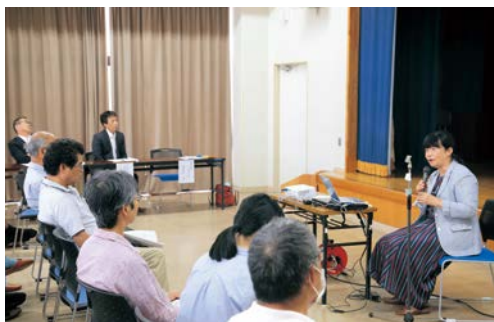
▲渥美半島の環境について学ぶ講演会