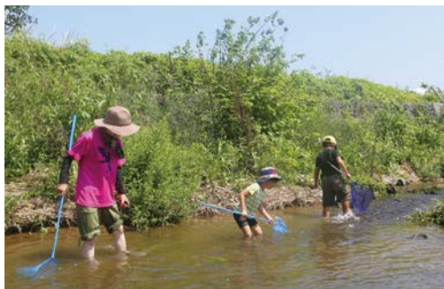
▲自然とふれあい、自然を楽しむ自然塾を開催 ～免々田川でガサガサしよう！

現在のところ、「未来につなぐ渥美半島の環境を考えるためのプロジェクト」として以下のことを行っています。