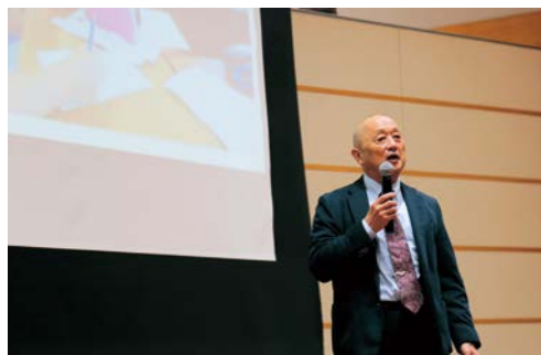
▲渥美半島の環境への思いを共有するフォーラム

渥美半島に生きる人たちがさまざまな視点から、渥美半島を見ていくことが大切です。「渥美半島の豊かな自然を未来につないでいきたい」という趣旨に賛同し、共に考え、行動してくれる人・団体を募集しています。ぜひ一緒に活動しませんか？連絡をお待ちしています。