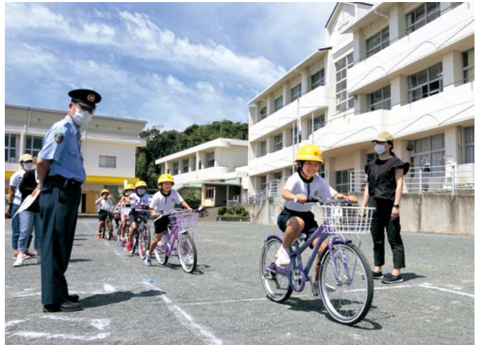
▲おそろおそろ自転車をこぎだす児童

この教室は、運動場と学校周辺の道路を使って行われ、児童は自転車の正しい乗り方と公道での安全な走行の仕方を身につけました。