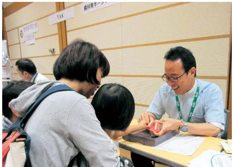
▲愛知県歯科技工士会による歯のパズルコーナー

田原市歯科医師会主催の歯の健康フェスティバルが田原文化会館で開催されました。このイベントは、むし歯や歯周病などの予防を目的に開催され、歯科検診やフッ化物塗布など、さまざまな催しが行われました。来場者は楽しみながら歯の健康を考えることができました。