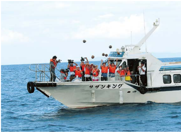
▲これまでに本市へは4個のやしの実が流れ着いています