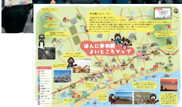
▲赤羽根地区まちづくり実行委員会の会員と作成したマップ