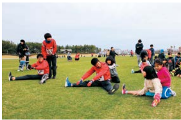
▲低学年と準備体操をする選手ら