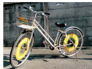
▲田原市レンタサイクルの自転車