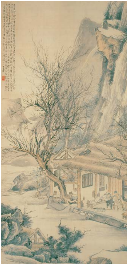
▲渡辺華山筆 黄梁一炊図(個人蔵)

き、出世の望みのないことを訴えました。そうしているうちに蘆生は眠くなり、仙人に枕を貸してもらって眠ると、自分が立身し、高い身分になって年老いて亡くなるまでの夢を見ました。しかし、夢を見ていたのは黄梁（大粟のこと）がまだ蒸し終