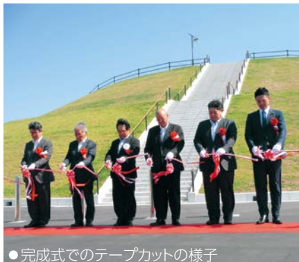
●完成式でのテープカットの様子

なお、名称であるほりきり広場は、堀切地区コミュニティ協議会が小中学生や地域住民から愛称を募集し決定したものです。