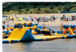
▲伊良湖のウォーターパーク

また、ビーチスライダーやウォーターパークといったアクティビティもあり、若い方も家族連れも楽しむことができます。