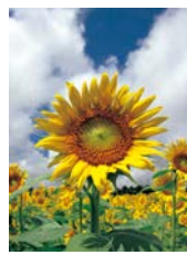
▲満開のヒマワリ畑

市内の遊休農地などで栽培しているヒマワリは、7月中旬から8月中旬にかけて見頃となっています。本市には4カ所のヒマワリ畑(伊良湖菜の花ガーデン、サンテパルクたはら、加治のヒマワリ畑、吉胡のヒマワリ畑)があり、太陽に向かって咲くヒマワリを楽しむことができます。カメラを片手に、真夏のヒマワリ畑を訪れてはいかかでしょうか。