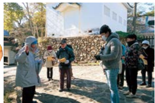
▲ふるさとボランティアガイドたはらの風

◎ガイドの依頼や観光ボランティアガイドに興味がある方は、「渥美半島観光ボランティアガイドの会」については商工観光課へ、「ふるさとボランティア」については、ガイドたはらの風へお問い合わせください。