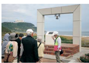
▲渥美半島観光ボランティアガイドの会

伊良湖岬周辺で観光ガイドを行っているボランティア団体です。恋路ヶ浜から伊良湖岬灯台周辺のいのりの磯道を通り、道の駅伊良湖クリスタルポルトまでのルートで海浜植物や糟谷磯丸のまじない歌などについて渥美半島の歴史と共に解説してくれます。