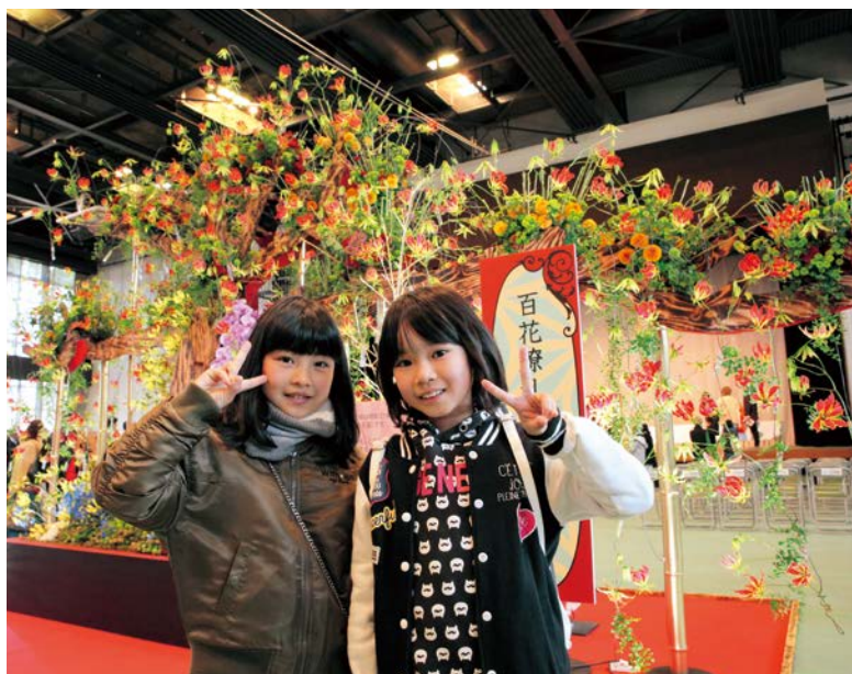
▲花のディスプレイ(百花繚乱のBONSAI)など会場全体が花で彩られました