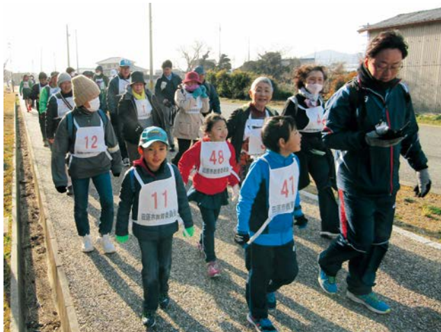
▲天候にも恵まれ、楽しそうにウォーキングを行う参加者たち

ゴールした参加者には、スポーツ推進委員が用意した温かい豚汁が振る舞われ、和やかな1日を過ごしていました。