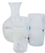
ガラス製品・ガラスくず