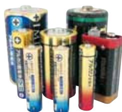
乾電池・ボタン電池・ 充電式電池