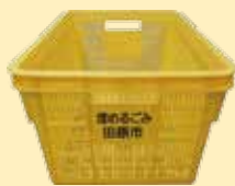
▲ 埋めるごみコンテナ

袋などから出して、コンテナに入れてください。ただし、小さなものは袋に入れるなどして、散らばらないようにしてください。