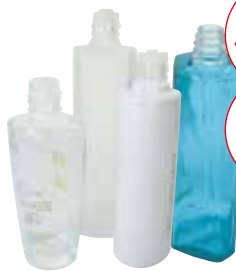
化粧品・香水のびん