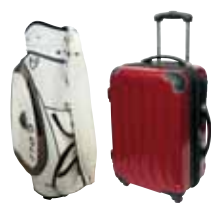
キャリーバック・ゴルフバック等