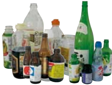
飲食類・調味料のびん