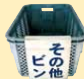
▲その他ビン コンテナ