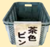
▲茶色ビン コンテナ