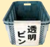
▲透明ビン コンテナ

袋などから出して、透明・茶・その他のびんごとに分けて、それぞれコンテナに入れてください。