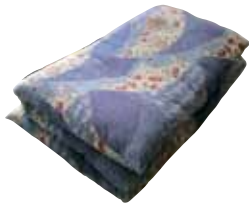
布団(綿入りのもの)