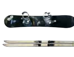
スキー板・スノーボード