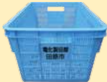
▲電化製品類コンテナ