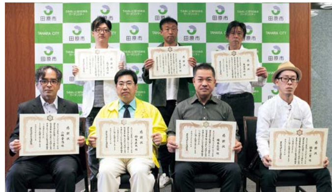
▲消防長から感謝状を贈呈された皆さん