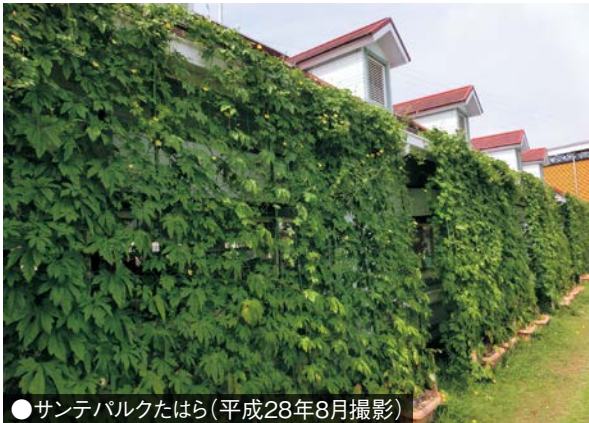
●サンテパークたはら(平成28年8月撮影)

今年も、夏の暑い日がすぐそこまで来ています。皆さんはどのようにしのぎますか。エアコンをつける？ 扇風機をつける？ 我慢する？