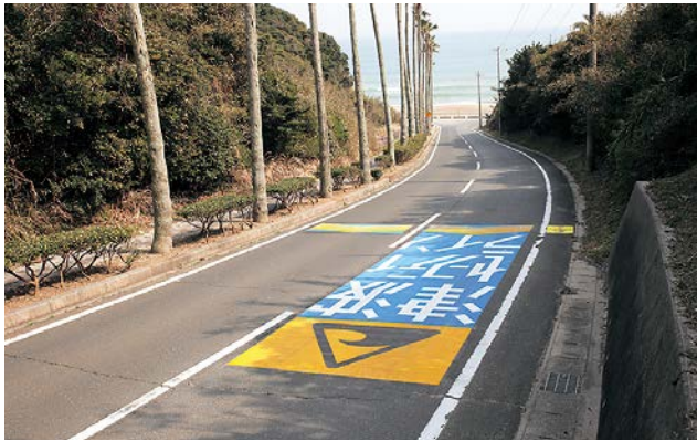
▲整備された津波セーフティライン(高松町弥八島)