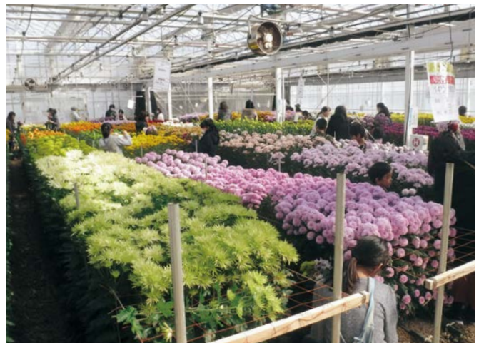
▲60品種のキクから素材選びができるのが大きな魅力

田原市低炭素施設園芸づくり協議会が主催した親子花育教室が、大久保町で開催されました。花に親しむきっかけづくりを目的に、親子でアレンジフラワーを制作するこの催し。会場となったハウスでは、自然エネルギーと省電力設備を活用してキクの栽培を行っています。参加した親子29組は、キクをふんだんに使って色彩豊かなアレンジフラワーづくりを楽しみました。