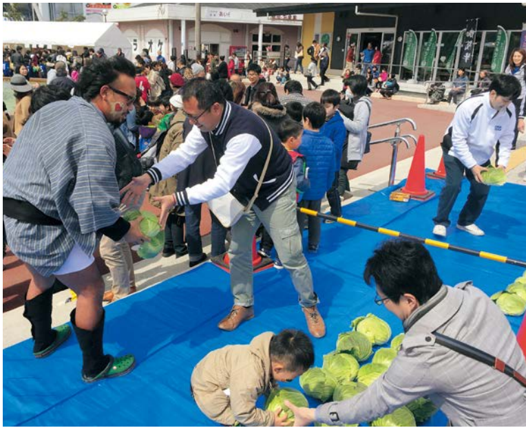
▲「キャベツリレー対決」は手渡しされたキャベツをより多く運んだ側の勝ち。産地の意地を見せた伊良湖側が見事に勝利しました!