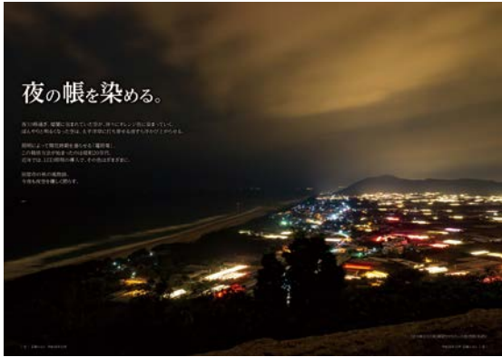
▲広報たはら平成28年12月号の見開き写真

広報企画部門においては、【この街を一緒に盛り上げよう！Instagram インスタグラム 】