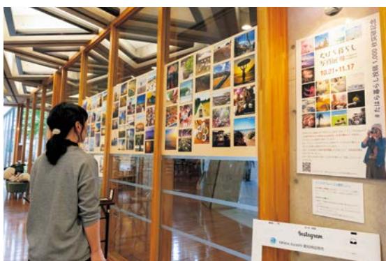
▲平成28年10月に開催した「たはら暮らし写真展」。市民や観光客の皆さんから投稿された写真を展示