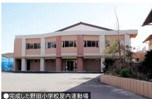
●完成した野田小学校屋内運動場