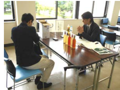
▲窓口利用のイメージ写真