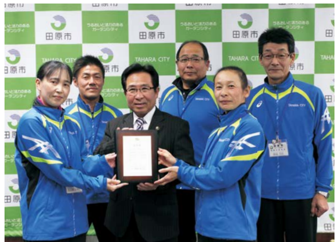
▲市長に喜びの報告をした田原市スポーツ推進委員会の皆さん

全国スポーツ推進委員連合優良団体表彰 を受賞した田原市スポーツ推進委員会の皆さんが、市長を表敬訪問しました。同推進委員会は、各地区から選ばれた29名で構成され、市内でスポーツ教室や出前講座を行っています。今回の表彰は、永年にわたり地域のスポーツ振興に努め、スポーツ文化の発展に貢献してきたことが評価されたものです。