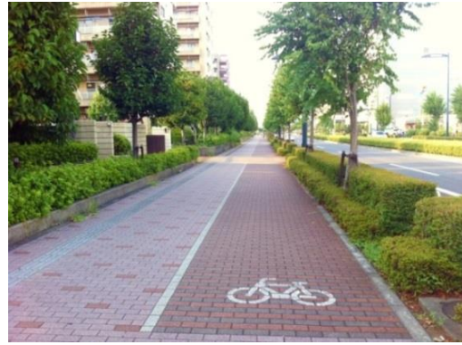
歩行者と自転車が分離された歩道