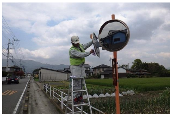
カーブミラーの点検