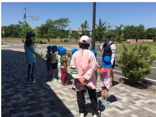
田原市交通公園を利用した交通安全教室