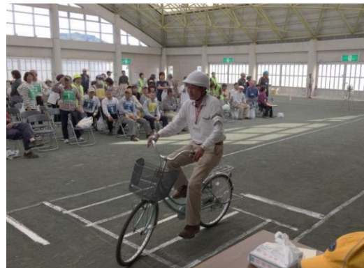
高齢者自転車大会