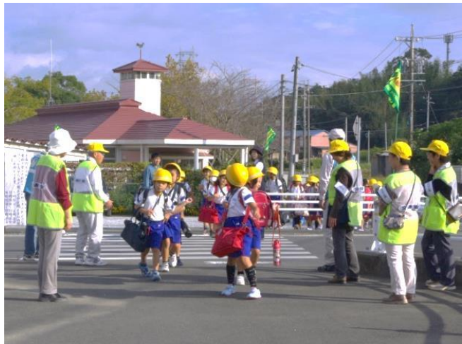
子どもの下校を見守るボランティア団体