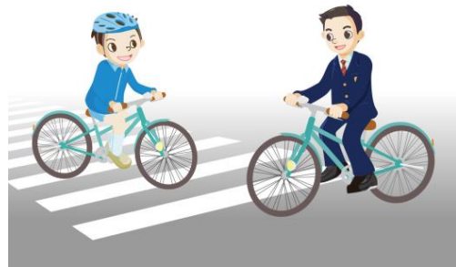
安全な自転車利用の技能を身につける