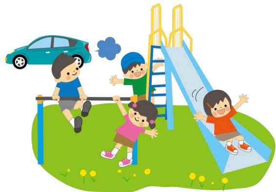
道路交通と分離した、安全な公園の整備に努める