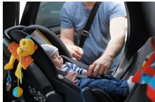
体重や年齢にあった着用の周知を図る