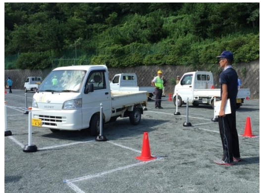
高齢者軽トラック大会