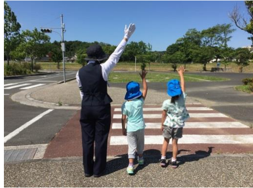
交通指導員による指導