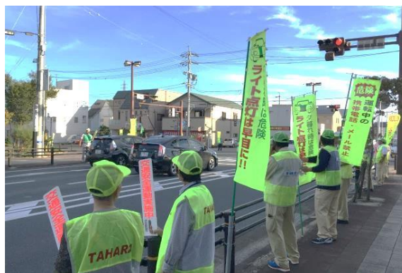
市民参加による街頭ボランティア活動