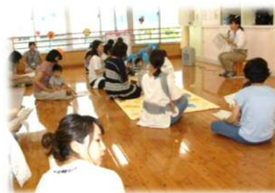
地域子育て支援センター

民間こども園内に設置された地域子育て支援センターの運営費を補助し、事業の充実を図る。