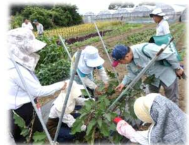
生き生き農業セミナー（野菜コース）