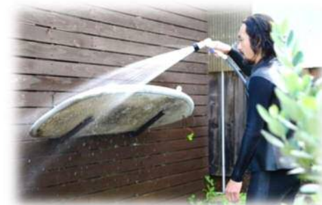
空き家を活用して移住されたサーファー