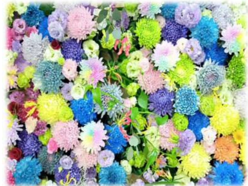
渥美半島の花の魅力発信と消費拡大の促進