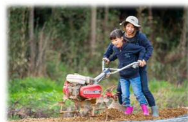
「たはら巡り～な」体験