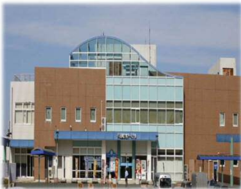
道の駅「伊良湖クリスタルポルト」の運営再開