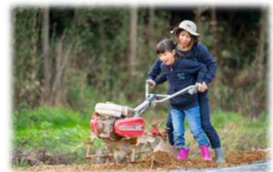
「たはら巡り～な」体験