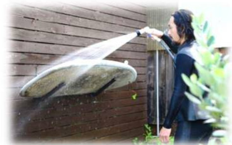
空き家を活用して移住されたサーファー