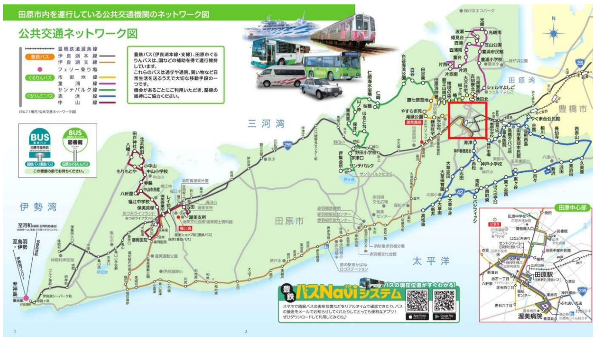
公共交通ネットワーク図（令和4年10月現在）