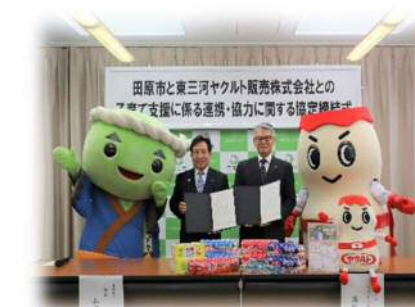
地元企業との子育て支援に関する連携