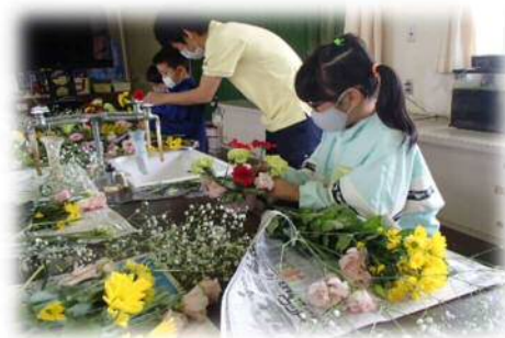
地域の花を使ったフラワーアレンジメント体験 泉小学校