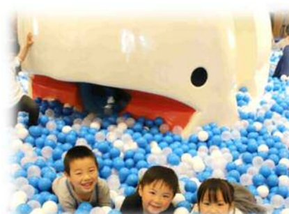
親子交流館「すくっと」(子育て世代包括支援センター)