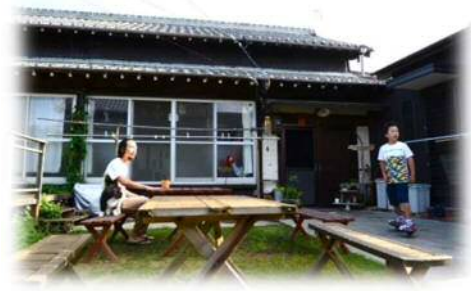
空き家活用の事例