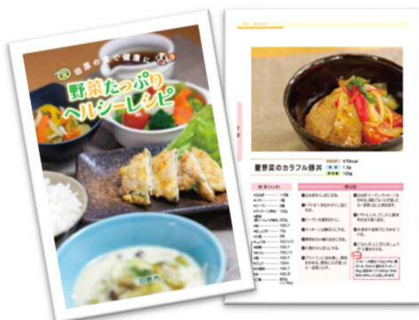
健康レシピ(野菜たっぷりヘルシーレシピ)