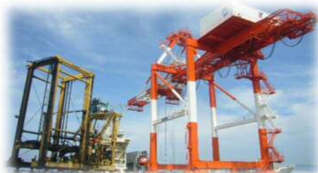
三河港（コンテナターミナル）