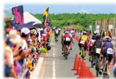
トライアスロン伊良湖大会