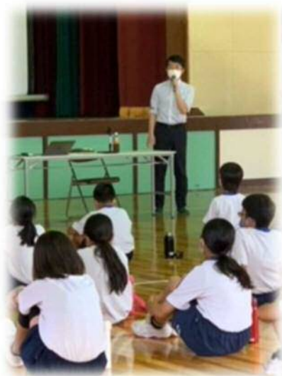
防災学習 清田小学校