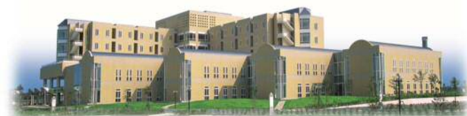
公的病院運営支援