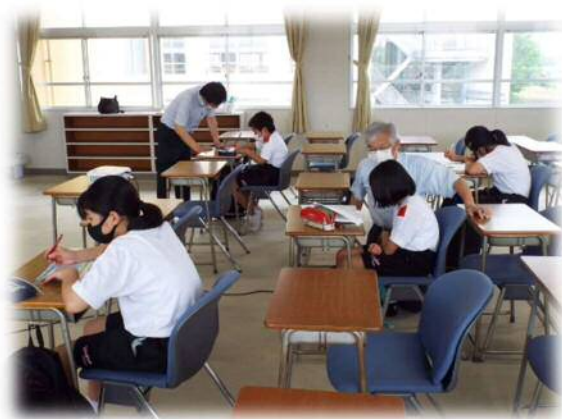
中学生を対象とした学習支援事業 東部中学校

幅広い地域住民等の参画を得て、地域全体で子どもたちの学びや成長を支える。地域学校協働活動推進員は、地域と学校をつなぐコーディネーターとして活動する。