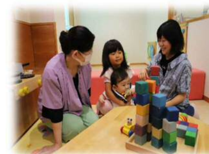
親子を見守る地域のボランティア