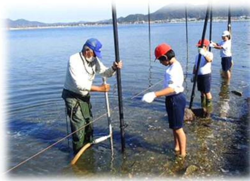
海苔づくりを学ぶ 福江小学校