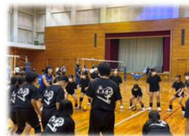
一流アスリートによるスポーツ教室の開催 (イメージ)