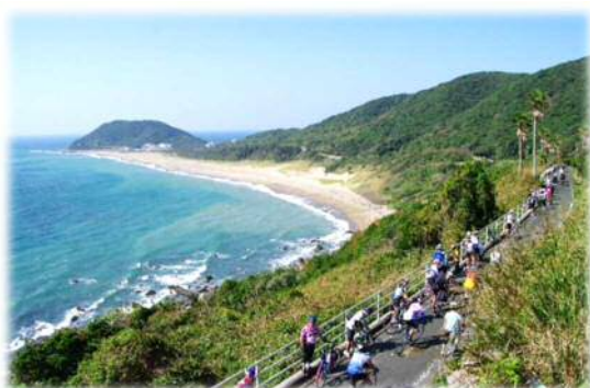
太平洋岸自転車道