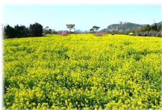
渥美半島菜の花まつり