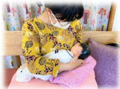
妊婦さんのおっぱいクラス