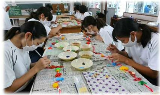
福江つるし飾りロード事業