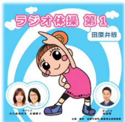
田原弁版ラジオ体操第一CD

健康づくりの輪を広げるため、健康づくりに興味を持たない層へ働きかけを行う「健幸アンバサダー」を養成、育成する。