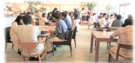
婚活セミナー「婚活♥交流カフェ」