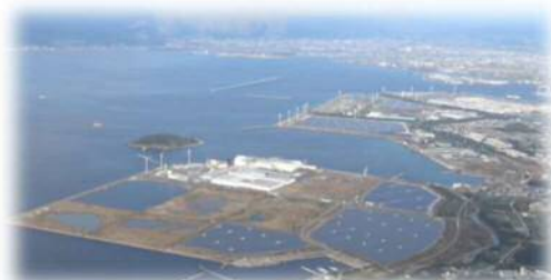
田原臨海部企業分譲地