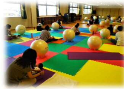
産後アフターピクス&ベビーピクス講座