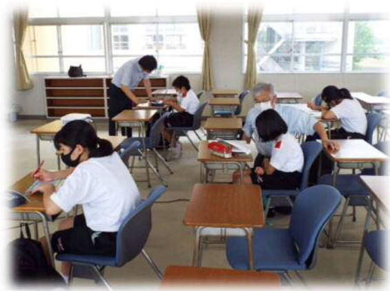
中学生を対象とした学習支援事業 東部中学校

幅広い地域住民等の参画を得て、地域全体で子どもたちの学びや成長を支える。地域学校協働活動推進員は、地域と学校をつなぐコーディネーターとして活動する。