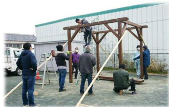
赤羽根地区まちなか賑わいづくり事業