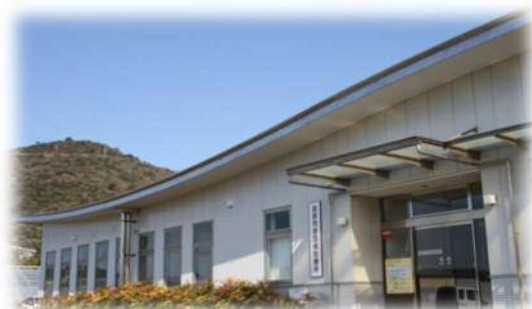
田原市赤羽根診療所