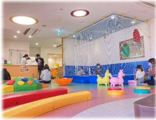
地域子育て支援センター

全ての妊婦や子育て家庭が安心して出産・子育てできるよう、妊娠届出時から一貫して身近で相談に応じ、その時々々の困りごとに即した支援につなげる、伴走型相談支援の充実を図る。