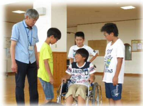
共生社会についての学習 田原中部小学校

学校を地域づくりの核として、学校施設の整備等を進めるとともに、特色ある教育を推進し、「地域とともにある学校」づくりを進めていく。