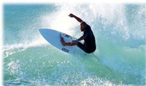
サーフィンを楽しむ移住されたサーファー

赤羽根地域を中心に、サーファーをはじめとする若者・子育て世代の移住数を増加させる施策等を進めることで、赤羽根地域の活力維持・拡大を図り、赤羽根地域だけでなく本市全域へと波及させ、持続的なまちづくりの発展へとつなげることを目指す。