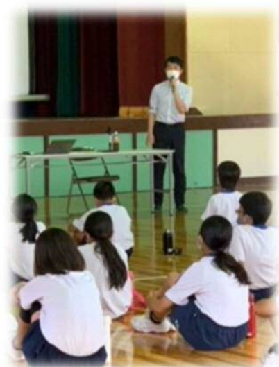
防災学習 清田小学校