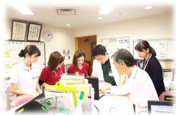
医療従事者の確保