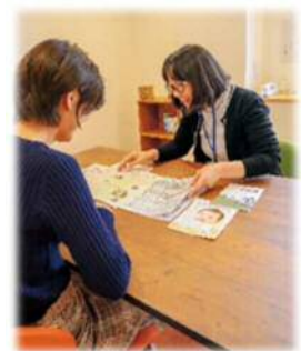
妊娠・出産・子育て総合相談窓口

不妊に関する検査・治療、及び不育症に関する検査・治療を受けた夫婦に対して、経済的な負担を軽減することにより、少子化対策の推進を図る。