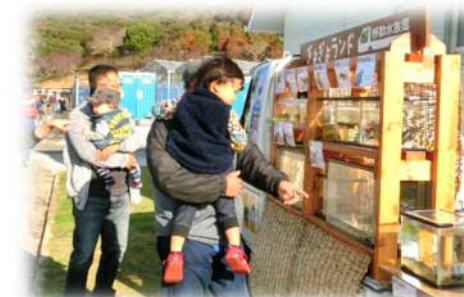
近隣施設との連携