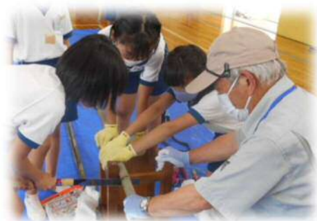
昔遊び体験「竹水鉄砲づくり」 衣笠小学校

学校を地域づくりの核として、学校施設の整備等を進めるとともに、特色ある教育を推進し、「地域とともにある学校」づくりを進めていく。