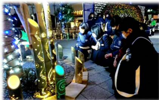
まちなか竹あかり事業