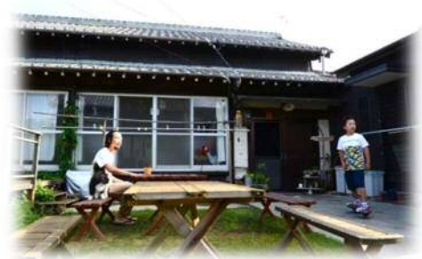
空き家活用の事例