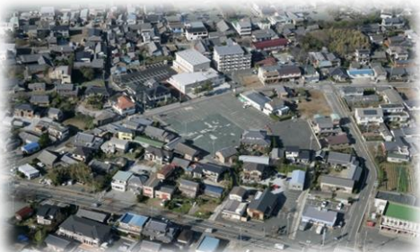
福江市街地（福江市民館周辺）