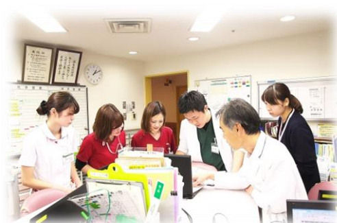
医療従事者の確保