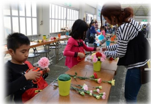
花育教室（フラワーアレンジメント）

近隣施設である「こども未来館ここにこ（豊橋市）」「赤塚山公園ぎょぎょランド（豊川市）」とイベント等を通じて交流連携することで、新たな集客を図る。