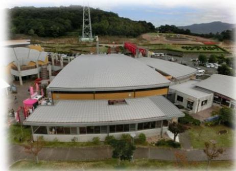
サンテパークたはら