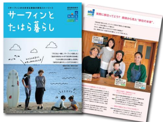
移住サーファーのインタビューを掲載した冊子