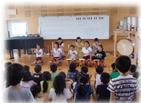
伝統継承（お囃子） 田原中部小学校

学校を地域づくりの核として、特色ある教育を推進し、地域を活性化することを目的として実施する。子どもたちが再発見した地域の魅力を活用した提案や活動を地域につなげ、地域の大人と一緒に実現していくことにより、地域全体の活性化を図る。