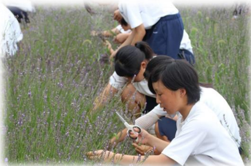
ラベンダーによる地域活性化 福江中学校