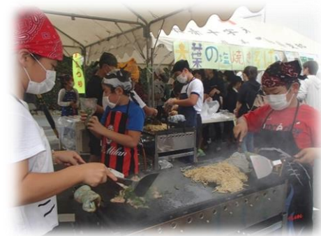
大葉による地域活性化 泉小学校