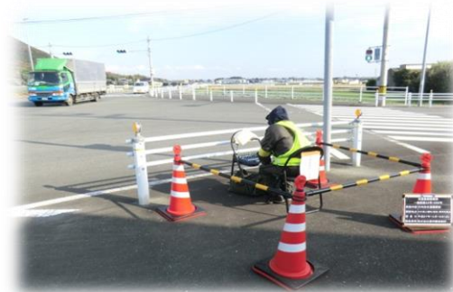
交通量調査（大久保町）