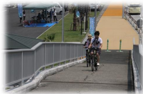
レンタサイクルの整備（伊良湖岬周辺）