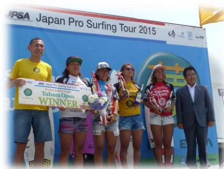
サーフィン大会でのビクトリーブーケの提供