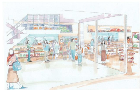
特産品販売所イメージ①