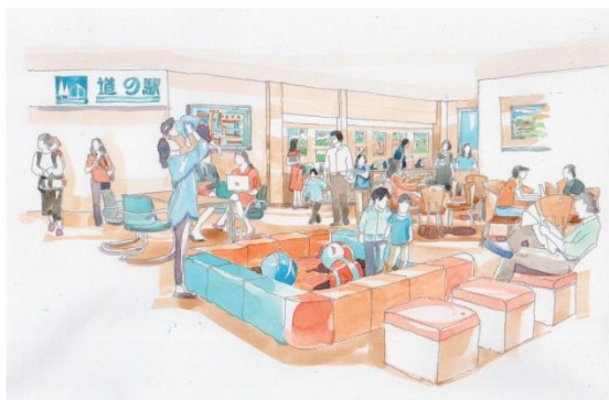
総合観光案内所イメージ