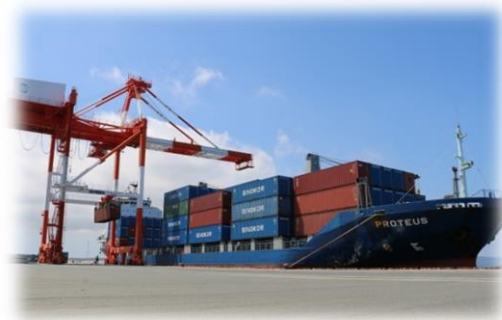
三河港（コンテナターミナル）