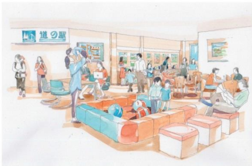
道の駅田原めつくんはうすリニューアル