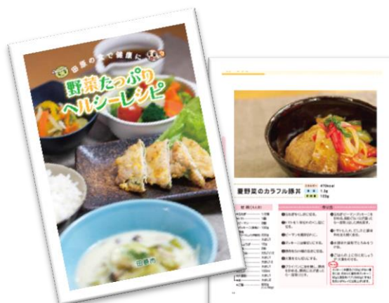
健康レシピ（野菜たっぷりヘルシーレシピ）