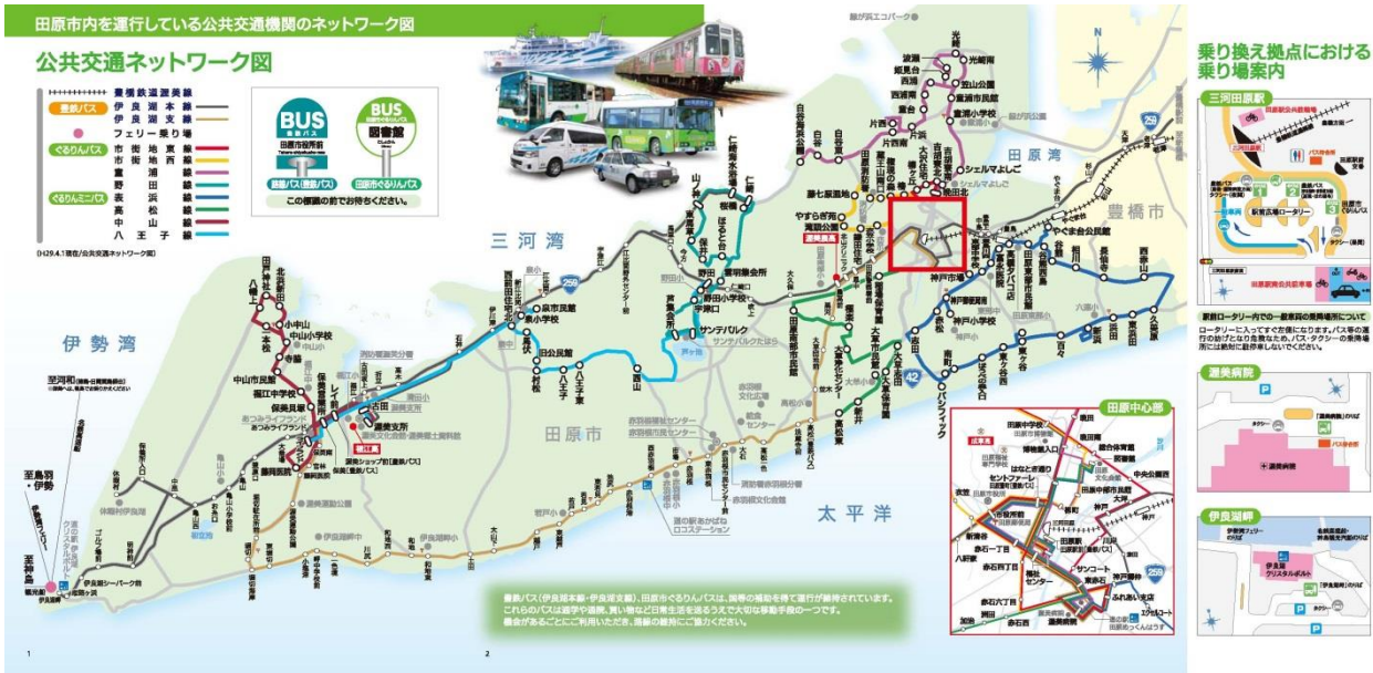
公共交通ネットワーク図

地域・市・運行事業者など関係者が連携・協働した利用推進及び運行内容の改善等に取り組み、運行を確保する。