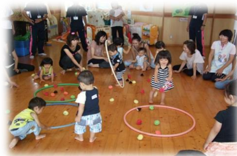
地域子育て支援センター