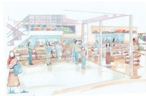
道の駅田原めつくんはうすリニューアル