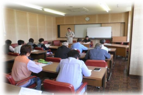
農業セミナー（座学）