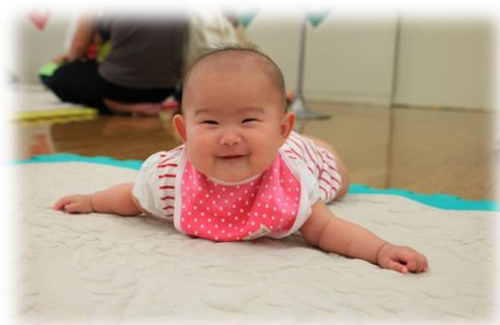
必要となる医師確保（小児科医）

市内の公的医療機関に医師として従事する意志のある者に対し、修学金を貸与して修学を援助し、地域医療における医師の確保を図る。