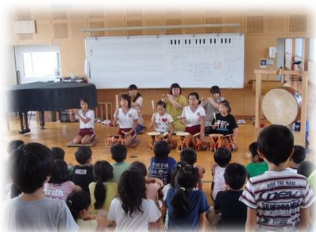
伝統継承（お囃子） 田原中部小学校

学校を地域づくりの核として、特色ある教育を推進し、地域を活性化することを目的として実施する。子どもたちが再発見した地域の魅力を活用した提案や活動を地域につなげ、地域の大人と一緒に実現していくことにより、地域全体の活性化を図る。