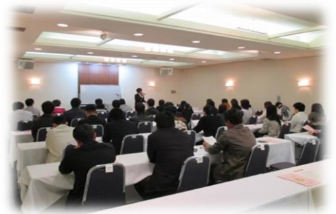
婚活イベント「自分磨き&男女交流会」

不妊検査、不妊治療を受けた夫婦に対して、経済的な負担を軽減することにより、少子化対策の推進を図る。