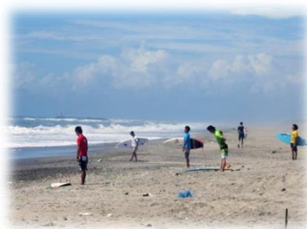
全日本サーフィン選手権大会