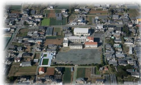
赤羽根市街地（赤羽根小学校周辺）