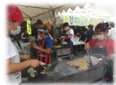
大葉による地域活性化 泉小学校