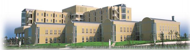
公的病院運営支援