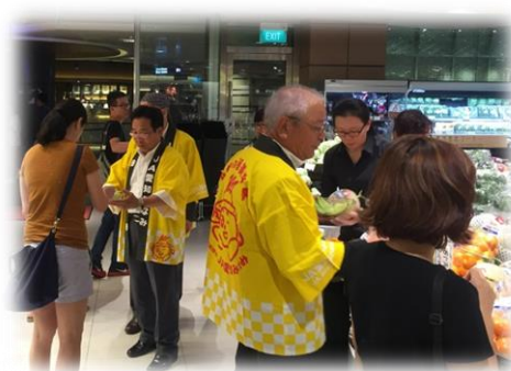
農畜産物等海外販路拡大（シンガポール）