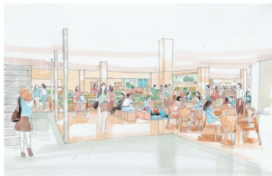
特産品販売所イメージ②