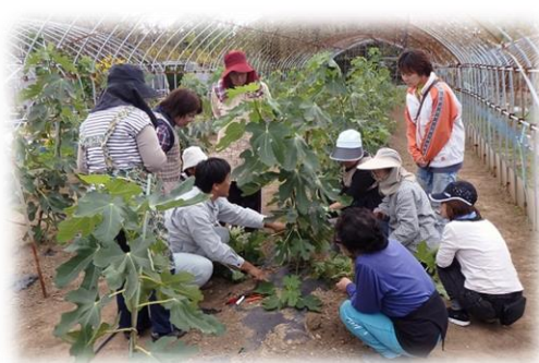
農業セミナー（実践指導）