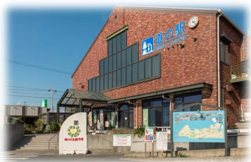
田原観光情報サービスセンター (道の駅田原めっくんはうす)

市の玄関口に当たる立地を活かし、半島観光のワンストップ窓口・プラットホームとして、道路利用者やインバウンドも含めた観光客に対する市全体の観光情報発信及び環境整備（観光案内所、JNTO認定所）を図る。