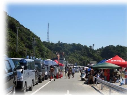
全日本サーフィン選手権大会