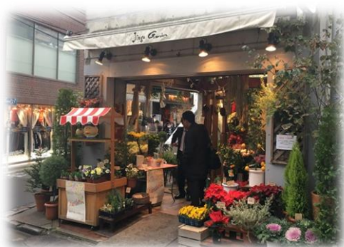
首都圏での花きの販売拡大・販売促進

「花」を活用した加工・販売・流通・6次産業化などの新たなビジネスを創出することにより、田原市の花き産業・施設園芸をさらに成長させ、持続的な花き生産に繋げる。また、花き産業・施設園芸の担い手、高度人材の育成を図る。