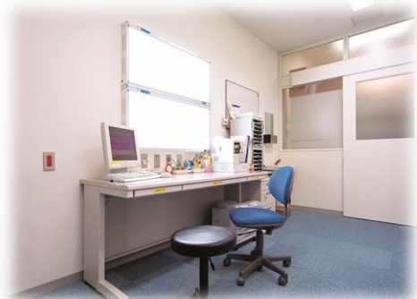
医療機関新規開業の促進

市内の公的医療機関に医師として従事する意志のある者に対し、修学金を貸与して修学を援助し、地域医療における医師の確保を図る。