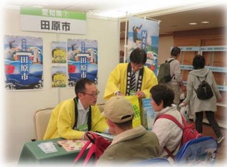
移住希望者への居住・雇用の情報提供