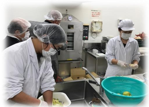
チャレンジ支援事業を活用した先進地視察