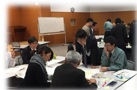
観光まちづくり大学