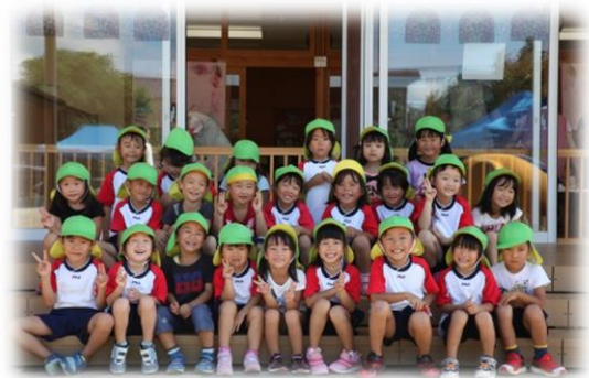
保育園の子どもたち