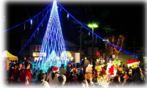
まちなか賑わい創出イベント（クリスマス）