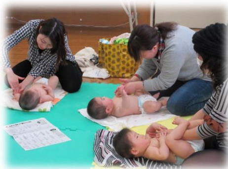
赤ちゃんサロン (ベビーマッサージ)