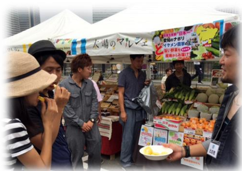
農業者等マルシェ出展（横浜北中マルシェ）