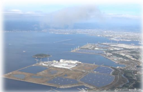
田原臨海部企業分譲地