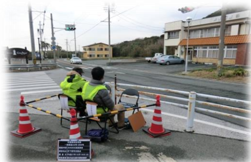
交通量調査（伊良湖町）