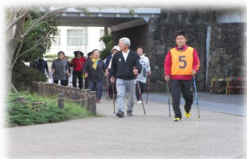
ノルディックウォーキング体験会