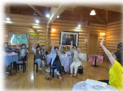
介護予防リーダーによる体操教室