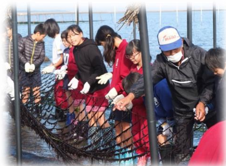
海苔の網打ち 福江小学校