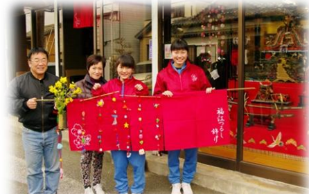
景観形成事業（つるし飾りロード）