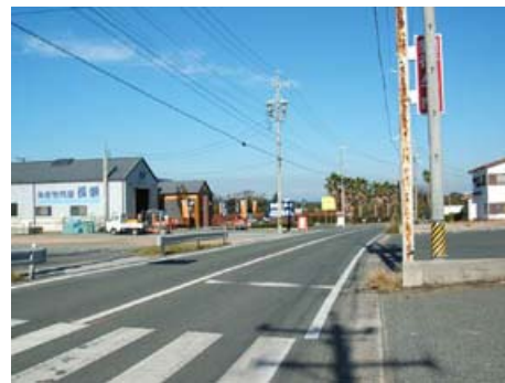
国道 259 号