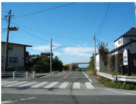
西ノ浜へのアクセス道