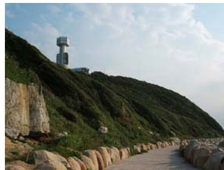
伊良湖岬 伊勢湾海上交通センター