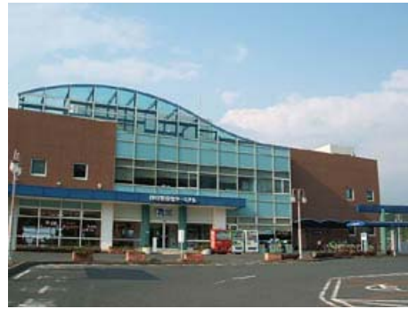
道の駅伊良湖クリスタルポルト