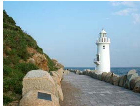
伊良湖岬 伊良湖岬灯台