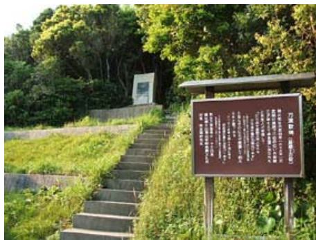
伊良湖岬 万葉の歌碑