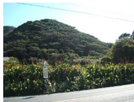
伊良湖岬 宮山 (国道 259 号より)