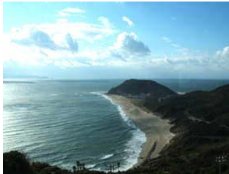
伊良湖岬 恋路ヶ浜

環境面では、宮山の原始林や恋路ヶ浜の海浜植物など貴重な自然資源を有しているが、海浜植物の減少などがみられる。