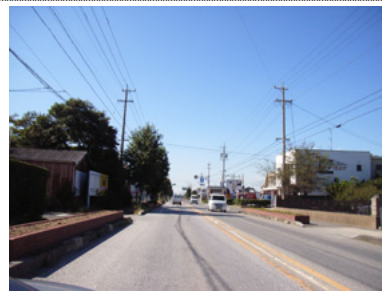
国道 259 号