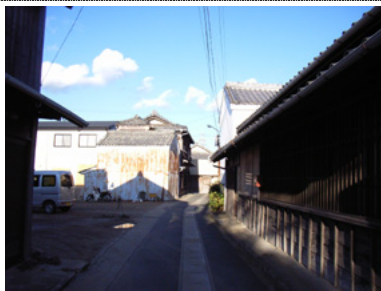
福江市街地内の小径