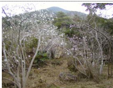
藤七原湿地 市指定天然記念物