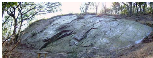
光岩 市指定天然記念物