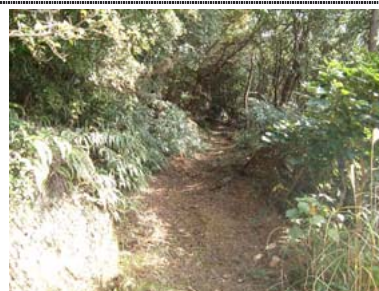
大山 トレッキングコース