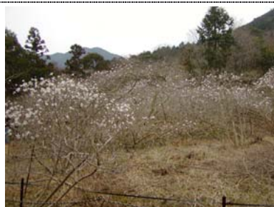
栂のシデコブシ 国指定天然記念物