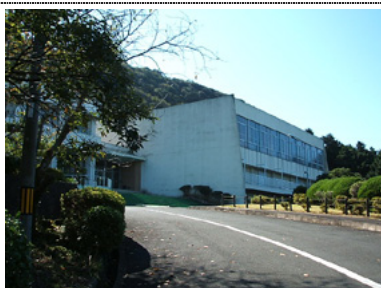
江比間野外活動センター