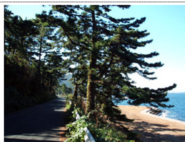
国道259号沿いのマツ並木