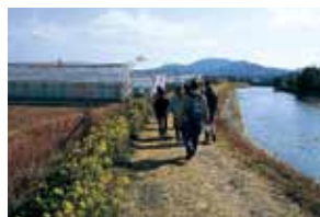
免々田川沿いの菜の花