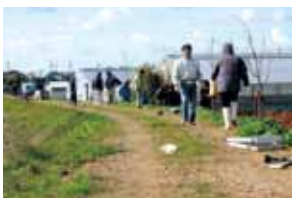
免々田川沿いの桜の植栽