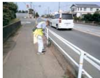
雑草の除去により美しい道路に