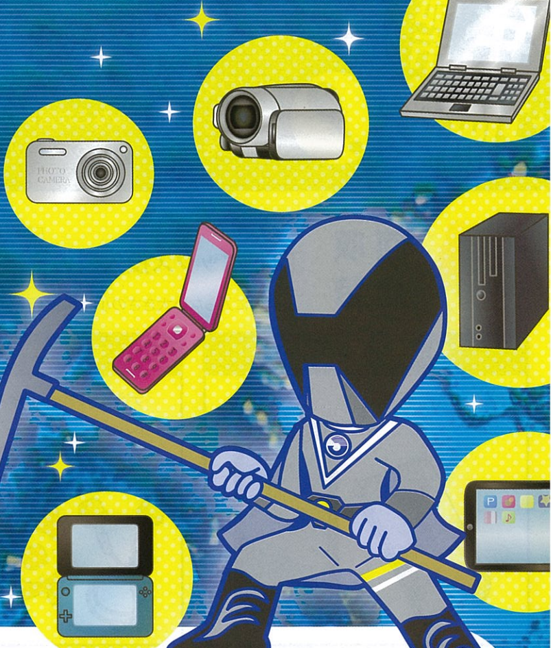
環境戦隊たはらエコレンジャー リサイクルレンジャー