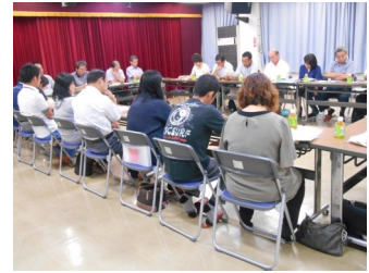
▲ 統合準備委員会の様子

A：物理的に路線バスに乗車できな い場合、時間帯が合わない場合など が考えられます。