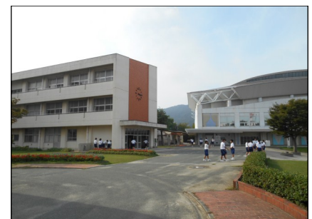
▲ 統合先の田原中学校

「田原中学校では、校区の範囲が広 く、40分近くかけて通学する生徒も いる」(田原中学校長)