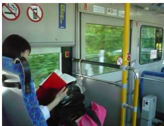
▲高校生のバス利用風景