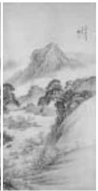
福田半香筆（静岡県指定文化財）「浅絳山水図」天保八年（1837）