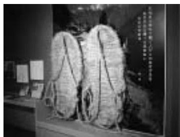
向山民俗学のシンボルとして地域の人々が作った大ワラジ

民俗研究を志し、伊那谷を中心にコツコツと調査をし、多くの著書とともに180冊余りの野帳（フィールドノート）を残しました。