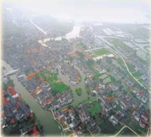
「東洋のベニス」といわれる昆山の景観