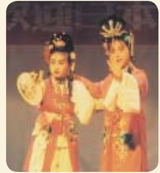
「昆劇」 京劇に並ぶ古典歌劇。元の時代に始まったと言われてい ます。

平成5年に旧赤羽根町と昆山市が友好都市提携を結んだことを皮切りに、中学生や行政関係者の相互派遣などを通じて交流を深めてきました。今年2月には、田原市の助役をはじめとする一行が昆山市を訪問しました。現在、これからの中学生交流事業や、友好都市提携の再調印などについて話し合いがもたれています。