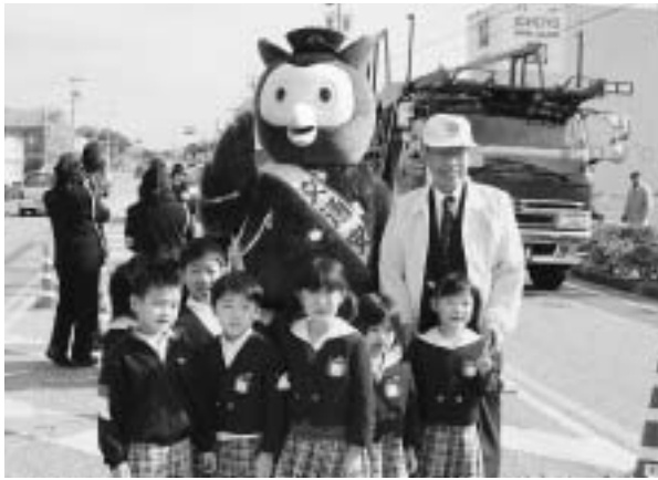
コノ八警部や白井市長と一緒に安全運転を呼びかけたよ