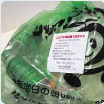
缶ともやせるごみが混ざって分別されていないごみ

収集日前日に出した場合も違反ごみとなります。ごみは、収集日当日の午前6時から8時までの間に出すようにしてください。